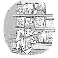
Nombre de bandes dessinées vendues par mois

Une librairie a compté le nombre de bandes dessinées vendues chaque mois de janvier à juin et a représenté les résultats sous forme d'un graphique.